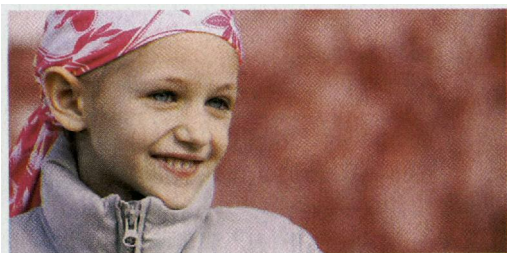
Деци је неопходна подршка и породице и целе заједнице

век болестан. Другима саветује да се у случајевима болести својих пријатеља или чланова породице никада не повлаче. Да их не сажалевају. Не морају ништа специјално да кажу, нека буду ту. Јер најгоре је кад од збуњености, да не погреше у нечему, не учине ништа, каткад се чак и не јаве болесној