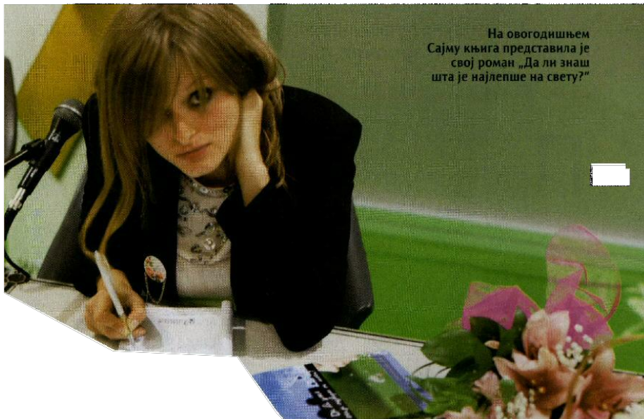
На овогодишњем Сајму књига представила је свој роман „Да ли знаш шта је најлепше на свету?“

- Бити жив то је најважније. Све је у човеку. Довољно је само да се пробудимо и откријемо ситуације које могу да нам улепшају дан.