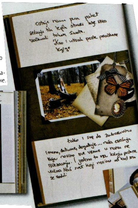
Делови Мартининог фото-дневника